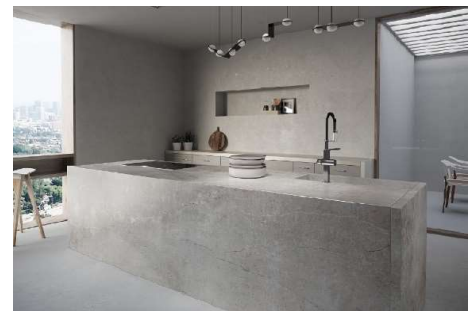
【カウンター : ソケ】

デクトンの高い耐傷性は日常使いに最適で、その硬度はクォーツと同等です。また極めて低い吸水率を誇り、水分の付着、染み込みを防ぎます。