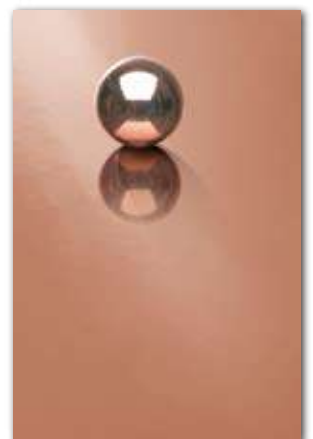
A212 (厚さ 0.9 mm) 設計価格：46,800 円

※製法上、製品には方向性があり、逆貼りによる濃淡の差が出る場合があります。施工前にあらかじめご確認ください。 ※本製品は内装用です。表面が金属製のため、一般メラミン化粧板の表面性能は有しておりません。外装用や耐摩耗性が必要な水平面、浴槽等の高湿度の場所やコンロ廻りの高温になる場所にはおすすめ出来ません。