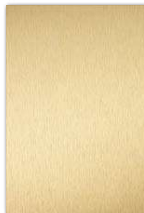
A251 (厚さ 0.8 mm) 設計価格：26,800 円