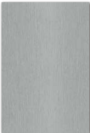
S296 (厚さ 0.8 mm) 設計価格：54,600 円