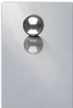
A210 (厚さ 0.9 mm) 設計価格：39,600 円