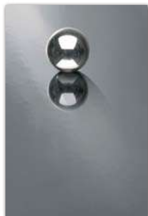
A216 (厚さ 0.9 mm) 設計価格：46,800 円