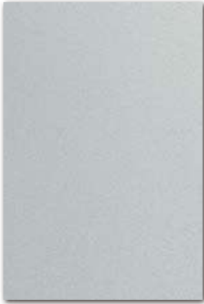
A820/000 (厚さ 0.8 mm) 設計価格：26,800 円