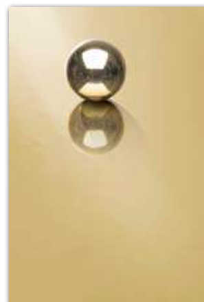
A211 (厚さ 0.9 mm) 設計価格：42,000 円