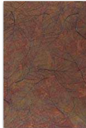
C421 (厚さ 1.0 mm) 設計価格：57,200 円