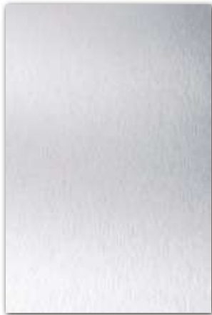
A350 (厚さ 0.8 mm) 設計価格：27,800 円