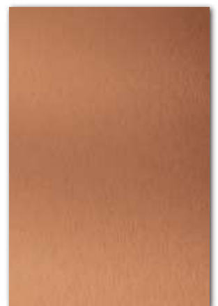
A252 (厚さ 0.8 mm) 設計価格：26,800 円