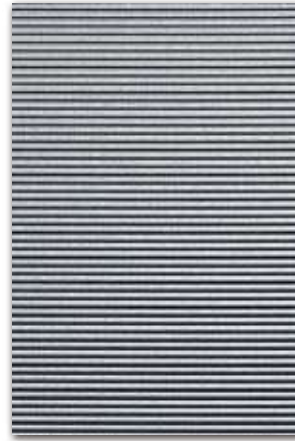
A446/920 (厚さ 0.9 mm) 設計価格：36,500 円