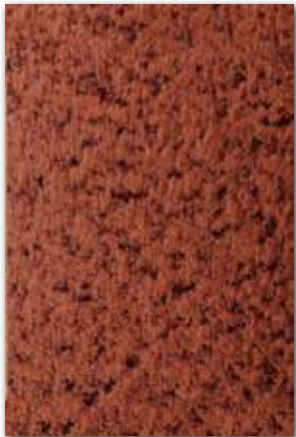
C462 (厚さ 1.0 mm) 設計価格：42,500 円