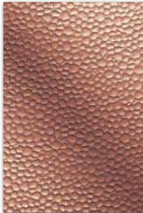
C473 (厚さ 1.0 mm) 設計価格：41,000 円