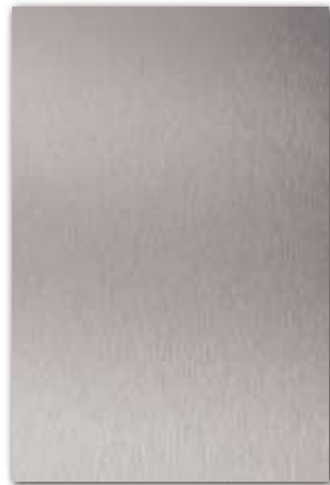
A356 (厚さ 0.8 mm) 設計価格：27,800 円