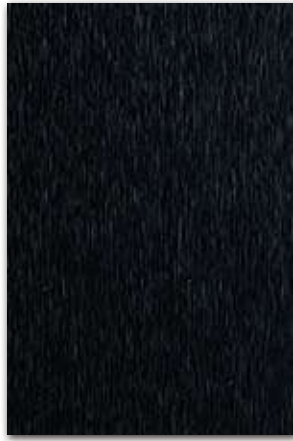
A448 (厚さ 1.0 mm) 設計価格：27,800 円