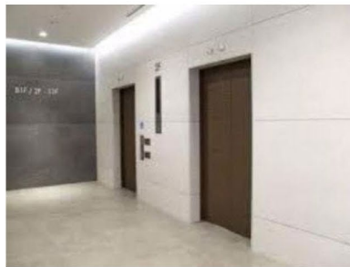
機能性ダイノック