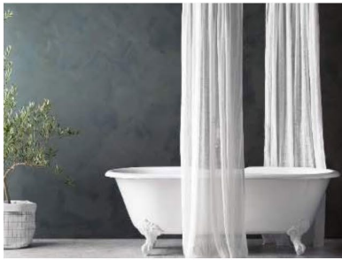
ヘイムスペイント