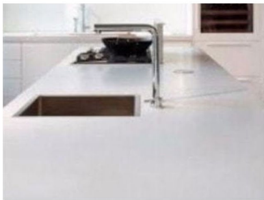
クォーツストーン・セラミック