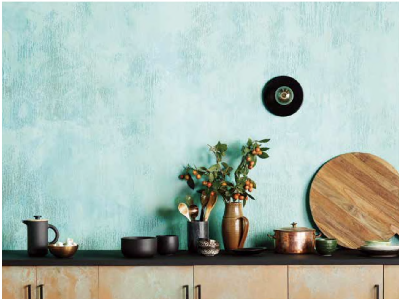
COPPER + PATINA